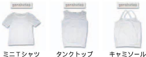
ミニTシャツ タンクトップ キャミソール