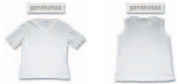
VネックTシャツ タンクトップ